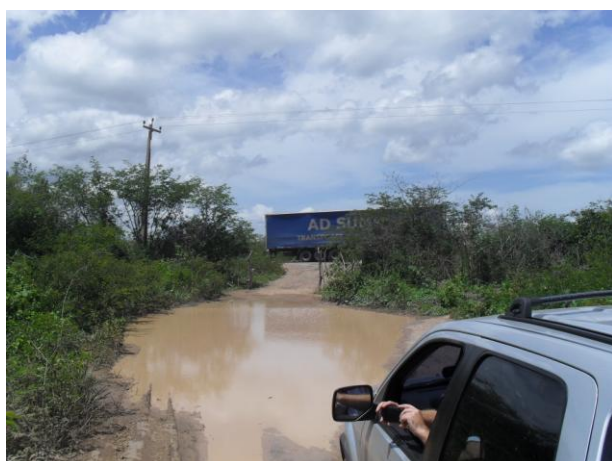
Foto 03 – Estrada carroçável alagada, que dá acesso à área do empreendimento e para a BR-222.