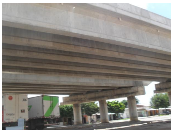
Foto 02 – Viaduto em construção na BR-222, na zona urbana de Tianguá, que promoverá acesso para várias cidades como Viçosa do Ceará-CE, Ubajara-CE e Teresina-PI.