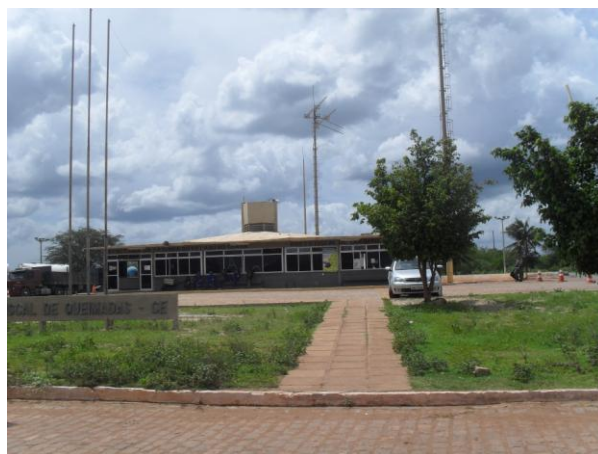
FOTO 11 – Localidade de Queimadas, dentro da área do empreendimento, onde está localizada o posto fiscal da SEFAZ-CE.