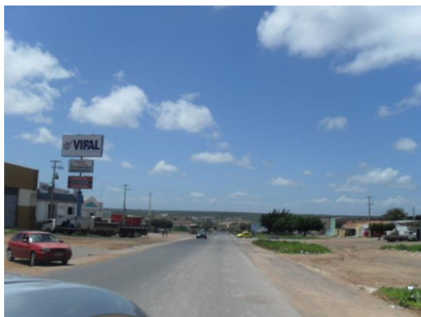
Foto 01 – BR-222, sentido Tianguá-Teresina, na zona urbana de Tianguá.