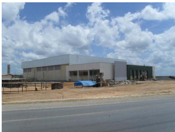
Foto 06 – Frente do novo posto fiscal da SEFAZ-CE em construção, ao norte do empreendimento, na rodovia BR-222.