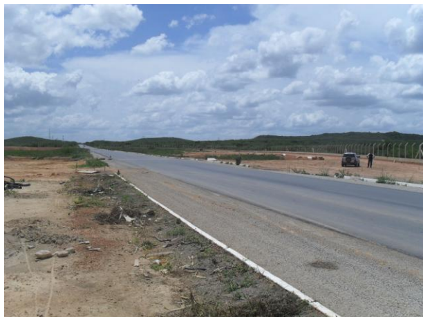
Foto 07 – BR-222, sentido Tianguá-Teresina, na localidade de Queimadas onde está sendo construído o posto fiscal da SEFAZ-CE.