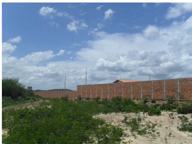
Foto 04 – Vista da parte de trás do novo prédio do Posto Fiscal da SEFAZ-CE, em construção, no setor norte do empreendimento, às margens da Rodovia BR-222.