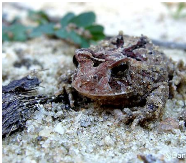
Foto 15 – Sapo-boi ( Proceratophrys cristiceps ) encontrado na área de influência indireta do empreendimento.