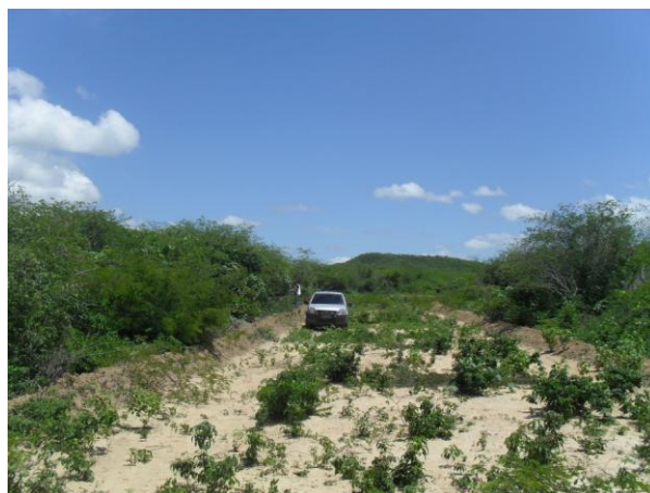
Foto 05 – Estrada carroçável abandonada no interior do empreendimento, com vegetação incipiente recobrando-a em toda sua extensão.