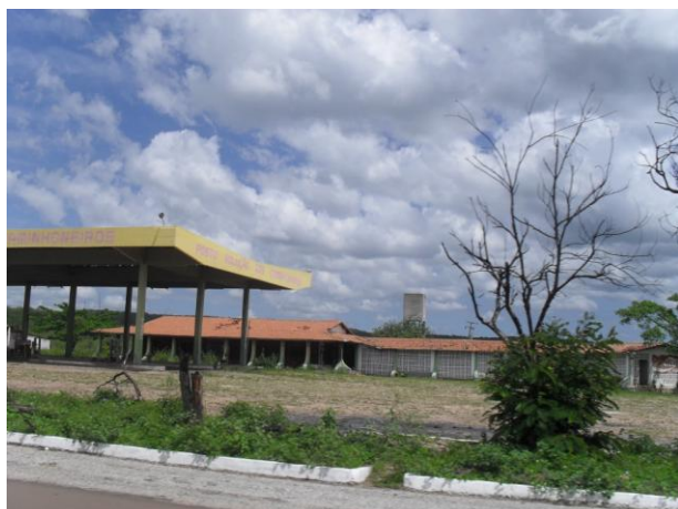
FOTO 12 – Posto de gasolina localizado dentro da área do empreendimento, na localidade de Queimadas, BR-222.