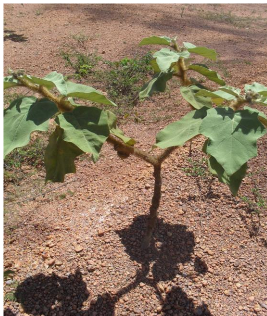
Foto 08 – Ciúme ( Cryptostegia grandiflora ), uma das principais espécies invasoras do estado, presente na área.