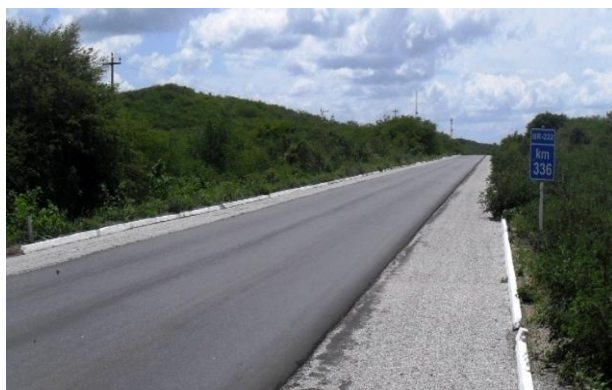
Foto 09 – BR-222, km 336, sentido Tianguá-Teresina, que tem como destaque o tipo vegetacional xerófilo chamado Carrasco.