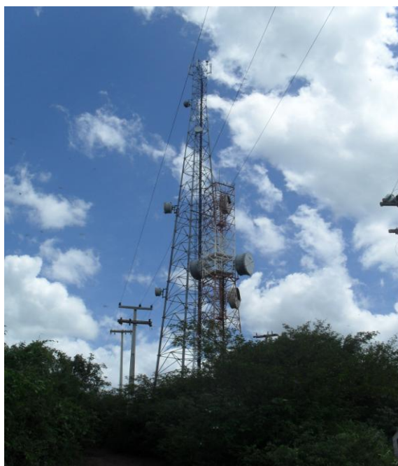
FOTO 10 – Torres de repetição de telefonia (EMBRATEL), localizadas dentro da área do empreendimento.